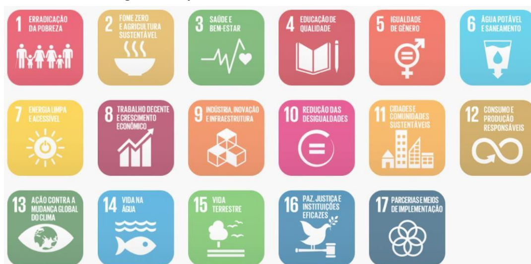
Figura 02: Objetivos de Desenvolvimento Sustentável

Em fortalecimento aos compromissos firmados pelo governo federal junto a ONU que fazem parte dos Objetivos de Desenvolvimento Sustentável – ODS, articulados através da agenda 2030, este projeto promove a utilização de estratégias para construção de edificações sustentáveis, como forma de garantir a sua resiliência e adaptabilidade em meio às mudanças climáticas. Sendo assim o mesmo foi desenvolvido com a utilização de sistemas construtivos capazes de contribuir para a preservação e conservação do meio ambiente, diminuindo o uso e o esgotamento dos recursos naturais, a produção de resíduos e o consumo de energia.